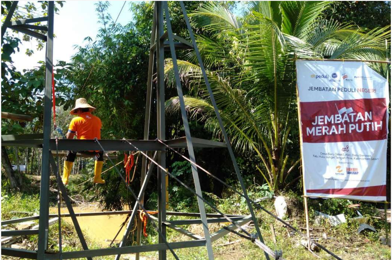
Foto : Pembangunan Jembatan di Kalimantan Selatan

Berkomitmen bangun 10 jembatan, Bakrie Amanah dan DT Peduli kembali berkolaborasi membangun jembatan perintis di Kalimantan Selatan. Pembangunan ini dilakukan secara bergotong royong dengan masyarakat setempat untuk membangun Jembatan Merah Putih. Jembatan ini adalah hadiah HUT RI Ke-76 kepada masyarakat Desa Baru (Waki), Kec. Hantakan, Kab. Hulu Sungai Tengah, Prov. Kalimantan Selatan. (9/8)