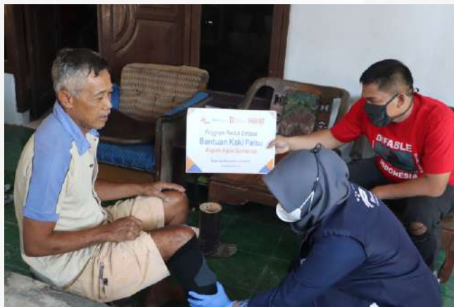
Foto : Bantuan kaki palsu