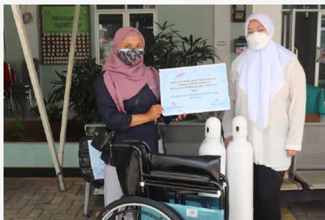
Foto : Tim Bakrie Amanah memberikan bantuan

Masih bersama dengan Alumni SMA 3 Teladan Jakarta 1966, Bakrie Amanah kembali mendistribusikan bantuan berupa Hazmat, tabung oksigen, dan kursi roda kepada tenaga kesehatan di Puskesmas Pondok Labu dan Kampung Sawah.