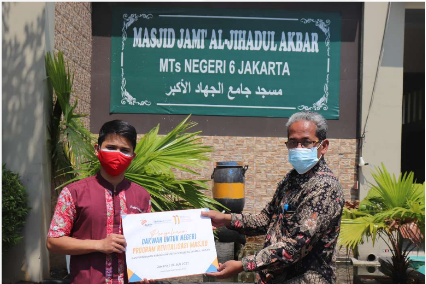
Foto : Serah terima bantuan revitalisasi

Penyaluran Bantuan Bahan Bangunan untuk Revitalisasi Masjid Al-Jihadul Akbar MTs Negeri 6 Jakarta (29/7). Sedang dalam melaksanakan pekerjaan renovasi masjid, Bakrie Amanah berikan bantuan bahan bangun untuk Masjid Al-Jihadul Akbar di Mts Negeri 6 Jakarta. Bantuan ini diberikan dalam rangka proses revitalisasi penyelesaian konstruksi masjid berupa granit untuk ruangan tempat solat wanita yang masih belum diselesaikan.