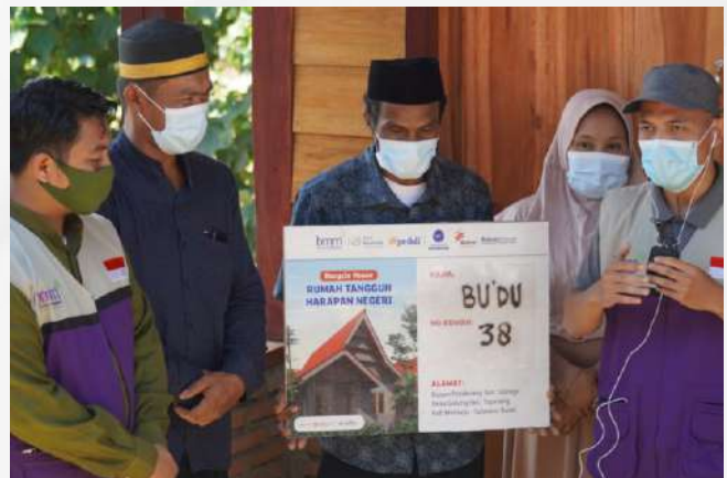
Foto : Peresmian Recyle House

Dengan konsep recycle house sebanyak 75 unit rumah sudah dibangun, tepatnya di Dusun Petakeang dan Dusun Talange, Kelurahan Galung, Kec Tapalang Kab Mamuju. Recycle house adalah pembangunan rumah dengan memanfaatkan bahan-bahan rumah yang masih dapat digunakan kembali, seperti: kusen, jendela, pintu, genteng dan kayu – kayu rangka rumah. Pembangunan ulang rumah ini juga melibatkan masyarakat penyintas dengan pola gotong royong.