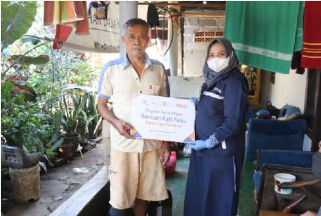
Foto : Tim Bakrie Amanah memberikan bantuan Kaki Palsu