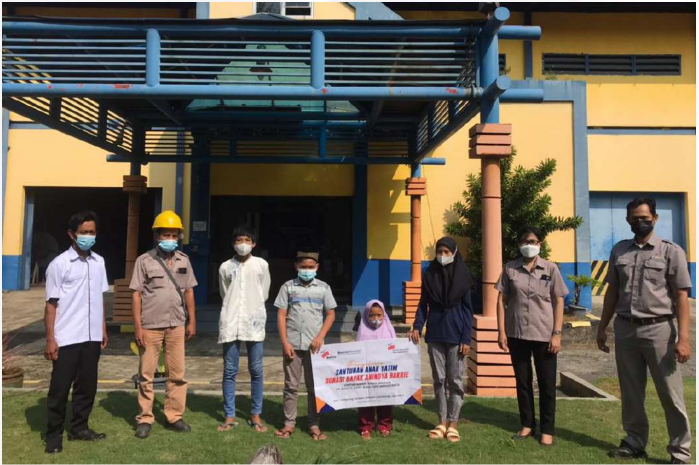
Foto : Penyaluran santunan

Dokumentasi kegiatan penyaluran santunan anak yatim dhuafa anak di PT South East Asia Pipe Industries, Lampung.