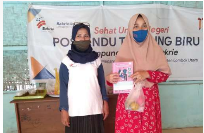
Foto : Kegiatan Posyandu Mandiri

Layanan posyandu mandiri di posyandu tunjung biru 1 Kp. Makmur Desa Medana Lombok Utara. Telah dilaksanakannya layanan posyandu untuk balita/batita dan ibu hamil. (6/8)