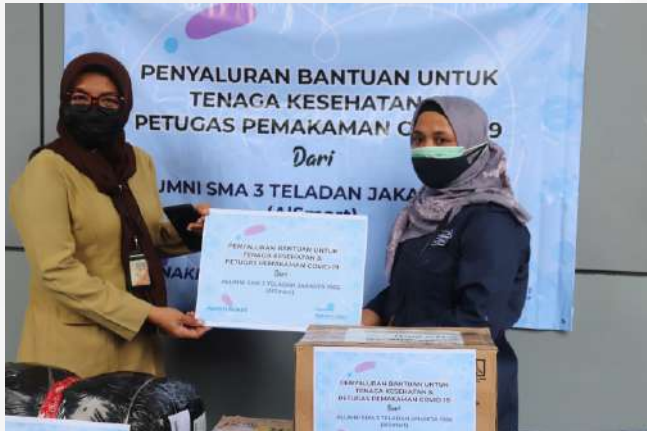
Foto : Tim Bakrie Amanah memberikan bantuan

Bakrie Amanah berkolaborasi dengan Alumni SMA 3 Teladan Jakarta 1966 mendistribusikan bantuan APD Berupa Hazmat dan minuman Vitamin kepada petugas pemakaman dan pengantaran Jenazah DKI Jakarta. Bantuan tersebut, berjumlah 200 pcs Hazmat dan 312 pcs Minuman vitamin. (13/7)