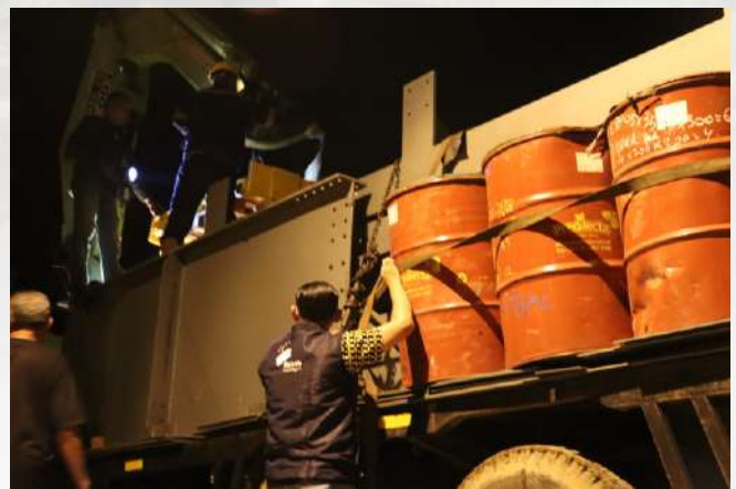
Foto : Proses penurunan girder jembatan Ciaasahan

Ketua RW di daerah tersebut mengucapkan banyak terimakasih kepada Bakrie Amanah atas bantuan yang telah diberikan. Mengingat daerah tersebut merupakan daerah penyintas bencana, hal itu membuat sajadah itu akan sangat berguna untuk kegiatan ibadah.