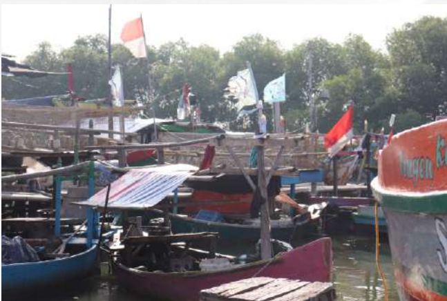
Foto : Lingkungan di Kampung Nelayan, Dadap

Masyarakat di Kampung Nelayan sangat berterima kasih karena telah di bantu untuk mendapatkan modal usaha kembali setelah mengalami penurunan penjualan akibat pandemi Covid-19. Beberapa usaha yang dijalani di Kampung Nelayan berupa bengkel motor kapal, warung rajungan, toko kerang, penjualan ikan laut dan masih banyak lagi.