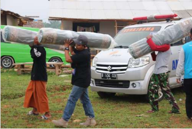
Foto : Penyaluran bantuan sajadah di Cigudeg

Proses perakitan jembatan semi permanen di Ciaasahan terus dilakukan. Mengingat sempat terhentinya perakitan jembatan akibat wabah pandemi Covid19 saat ini perakitan telah dilakukan. Jembatan yang dibangun atas kerjasama Bakrie Amanah, DT Peduli, YBM PLN & PT Bakrie Metal Industries ini merupakan jembatan type-C semi permanen yang dipersembahkan khusus untuk warga di Ciaasahan yang pada awal tahun 2020 terkena Air Bah sehingga membuat akses di wilayah tersebut putus.