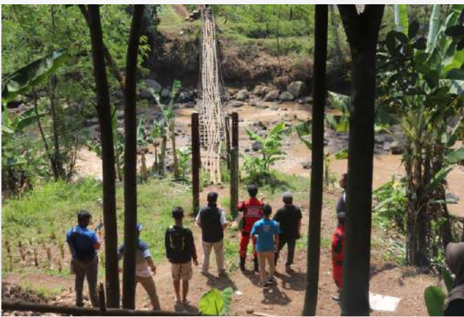
Foto : Tinjau Medan Jembatan Gantung di Sungai Cimeta

Proses perakitan jembatan semi permanen di Ciaasahan terus dilakukan. Mengingat sempat terhentinya perakitan jembatan akibat wabah pandemi Covid19 saat ini perakitan telah dilakukan. Jembatan yang dibangun atas kerjasama Bakrie Amanah, DT Peduli, YBM PLN & PT Bakrie Metal Industries ini merupakan jembatan type-C semi permanen yang dipersembahkan khusus untuk warga di Ciaasahan yang pada awal tahun 2020 terkena Air Bah sehingga membuat akses di wilayah tersebut putus.