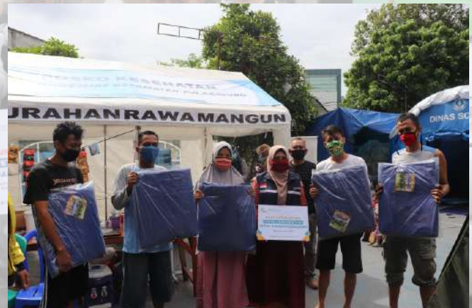
Foto : Serah terima bantuan untuk korban kebakaran, Rawamangun

Bakrie Amanah bersama DT Peduli & Vertical Rescue Indonesia melakukan tinjau medan untuk lokasi pembangunan kembali jembatan gantung di Sungai Cimeta, Desa Cipatat, Kab. Bandung Barat pada 26 Juli 2020. Rencananya jembatan yang akan menghubungkan dua desa ini bisa segera digunakan dibulan Agustus ini sebagai hadiah untuk warga disana dalam memperingati hari kemerdekaan Indonesia. Jembatan ini dalam kesehariannya digunakan untuk akses sekolah, perdagangan, akses kesehatan dan kebutuhan komoditas lainnya.