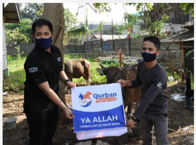
Foto : Serah terima hewan qurban oleh Ketua Qurban & ANTV

Selain itu sama seperti tahun-tahun sebelumnya, Bakrie Amanah juga menebarkan di berbagai wilayah di Indonesia seperti di Lombok, Bima,