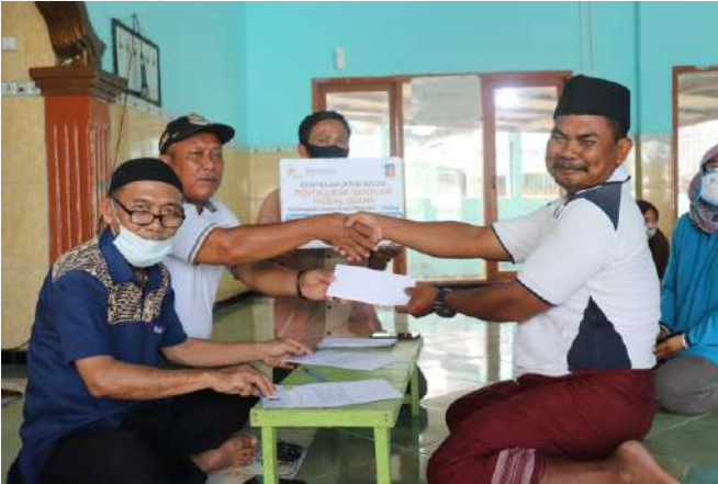
Foto : Serah terima bantuan modal usaha di Kampung Nelayan 3 Juli 2020

Bakrie Amanah terus gencar melakukan pemberdayaan untuk masyarakat-masyarakat yang memiliki keinginan untuk berwirausaha. Salah satunya melakukan pemberdayaan di Kampung Nelayan, Dadap, Kabupaten Tangerang. Dalam hal ini Bakrie Amanah menyuntikan dana bergulir untuk sebesar 40 juta untuk 20 penerima manfaat, yang artinya setiap penerima manfaat mendapatkan modal usaha sebesar 2 juta rupiah.