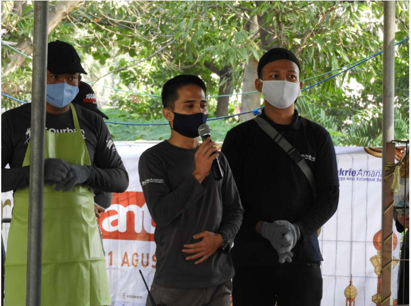
Foto : Ceremoni pembukaan acara oleh Ketua Qurban 1441 H