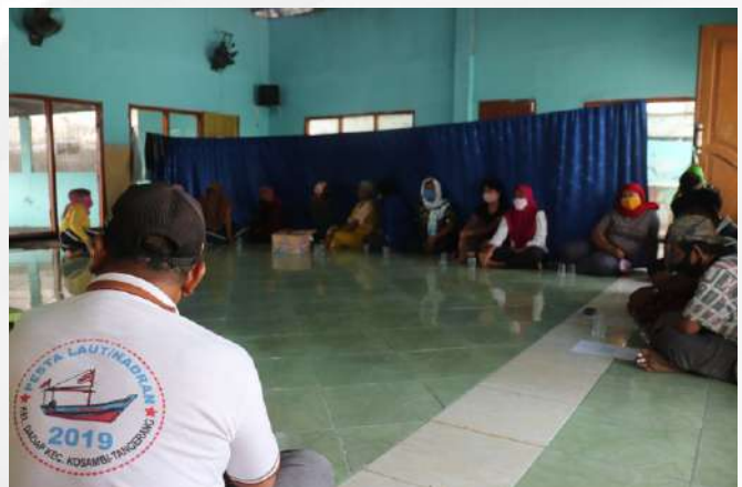
Foto : Sosialisasi program pemberdayaan di Kampung Nelayan, Dadap

Untuk diketahui selama masa pandemi Covid19 ini masyarakat yang mayoritas bekerja sebagai nelayan ini tak bisa menjual hasil lautnya karena seluruh pasar tidak diperbolehkan untuk beroperasi. Hal itulah yang membuat masyarakat disini kehilangan sumber penghasilannya. Dengan adanya bantuan modal usaha disini, sudah terlihat banyak kemajuan-kemajuan yang terjadi salah satunya adalah kemajuan ekonomi sejak