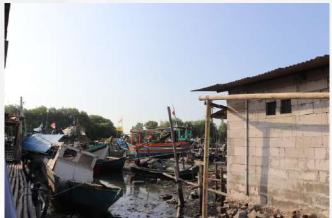
Foto : Lingkungan di Kampung Nelayan, Dadap