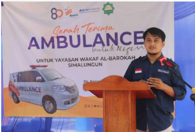
Foto : Sambutan Bakrie Amanah di acara peresmian Ambulance

Sebagai salah satu bentuk kepedulian kepada masyarakat dalam meningkatkan pelayanannya dalam bidang kesehatan, Bakrie Amanah berikan bantuan Ambulance kepada Yayasan Wakaf Al Barokah Simalungun, Sumatera Utara (24/9). Satu unit mobil baru Ambulance yang bertajuk Ambulance untuk Negeri juga dilengkapi dengan peralatan medis dan alat-alat kesehatan lainnya untuk menunjang kebutuhan mobil Ambulance.