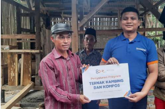
Foto : Serah terima program

Bakrie Amanah memberikan hibah berupa penyediaan Kandang Kambing, Bibit Kambing, serta Alat Pengolahan Limbah Kambing menjadi Pupuk Kompos (5/9). Bantuan ini diberikan kepada kelompok petani Kopi Berkah Tani binaan Bakrie Amanah yang berada di Desa Sukamurni dan Desa Dangi, Kecamatan Cilawu, Kabupaten Garut.