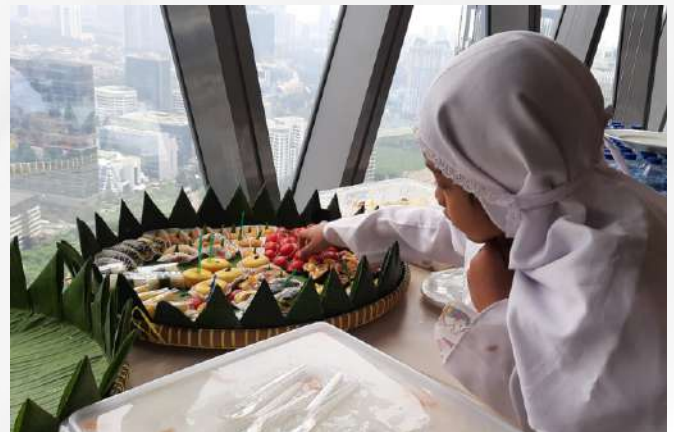
Foto : Anak Negeri sedang menikmati hidangan