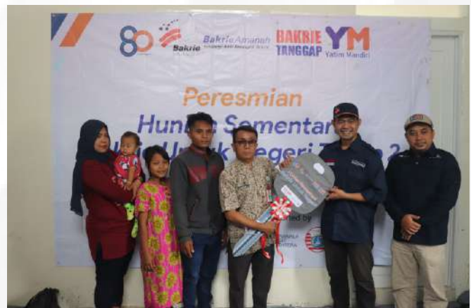
Foto : Serah Terima unit Hunian Sementara