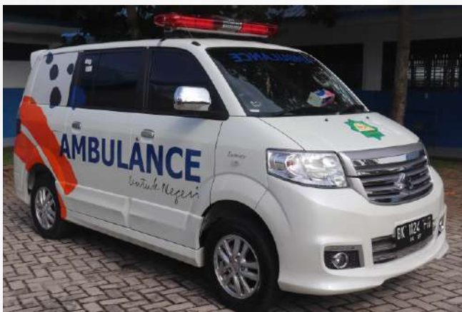
Foto : Penampakan Mobil Ambulance

Sebagai salah satu bentuk kepedulian kepada masyarakat dalam meningkatkan pelayanannya dalam bidang kesehatan, Bakrie Amanah berikan bantuan Ambulance kepada Yayasan Wakaf Al Barokah Simalungun, Sumatera Utara (24/9). Satu unit mobil baru Ambulance yang bertajuk Ambulance untuk Negeri juga dilengkapi dengan peralatan medis dan alat-alat kesehatan lainnya untuk menunjang kebutuhan mobil Ambulance.