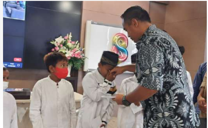
Foto : Serah terima santunan

Milad ke 38 Tahun PT Multi Kontrol Nusantara melalui Bakrie Amanah Salurkan Santunan untuk 100 Anak Yatim & Dhuafa (31/8).