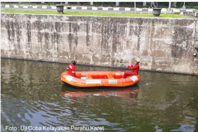
Foto : Uji Coba Kelayakan Perahu Karet

Demi mendukung penunjang aktifitas kelayakan saluran air, Bakrie Amanah mendukung kepada tim perawatan sungai Epicentrum dengan meminjamkan perahu karet untuk kebutuhan perawatan kesejahteraan sungai. Untuk kali ini tim inspeksi sungai Epicentrum sedang melakukan uji coba kelayakan perahu karet (28/9). Dengan kondisi yang masih bagus perahu karet Bakrie Amanah sangat bermanfaat untuk pengelolaan dan perawatan sungai kedepannya.