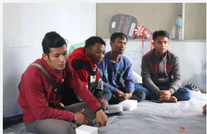
Foto : Penerima unit Hunian Sementara sedang menghadiri peresmian