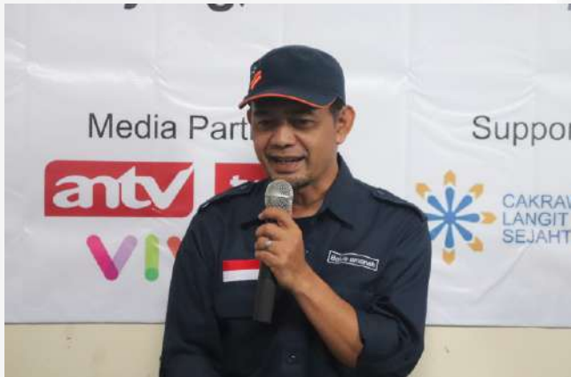
Foto : Sambutan General Manager Bakrie Amanah

Setelah dilakukan groundbreaking dan peresmian hunian sementara (hunlara) tahap pertama pada 16 Juni 2022 yang lalu, setelahnya Bakrie Amanah yang berkolaborasi dengan Yatim Mandiri melakukan peresmian hunian sementara tahap kedua di Kabupaten Lumajang, Selasa (30/8/2022).