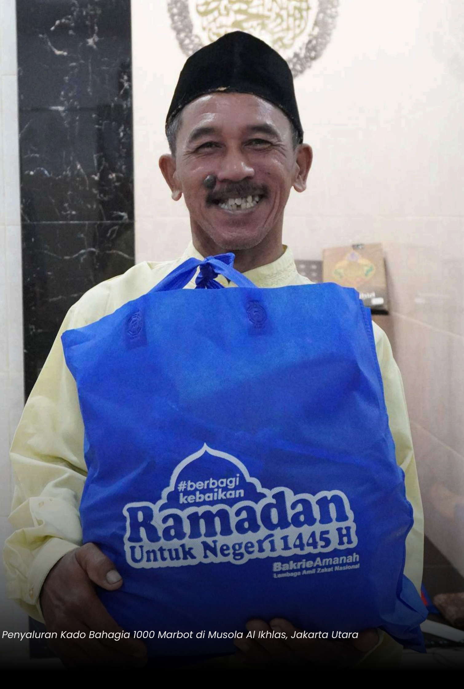
Penyaluran Kado Bahagia 1000 Marbot di Musola Al Ikhlas, Jakarta Utara