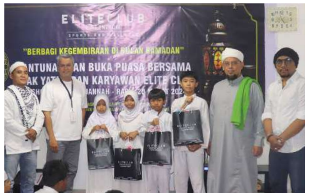
Santunan Yatim/Duafa dan Buka Bersama Karyawan Elite Club