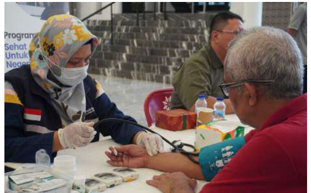
Donor Darah dan Layanan Kesehatan Masjid Nurul Hidayah Brawijaya