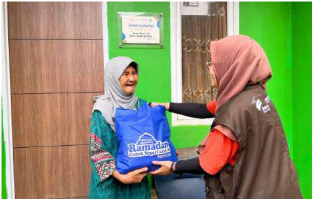
Kado Bahagia Ramadan di Sukabumi