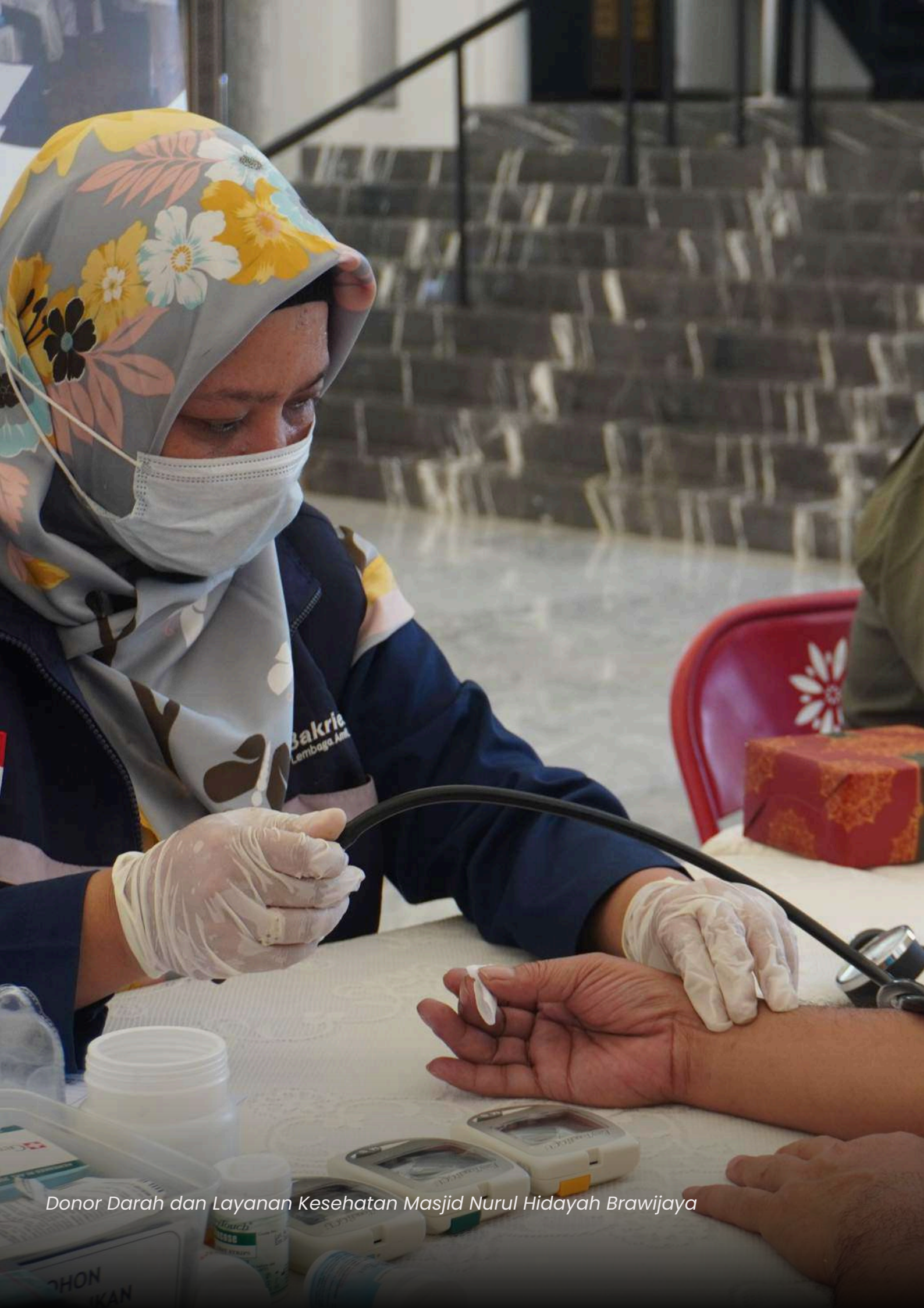
Donor Darah dan Layanan Kesehatan Masjid Nurul Hidayah Brawijaya