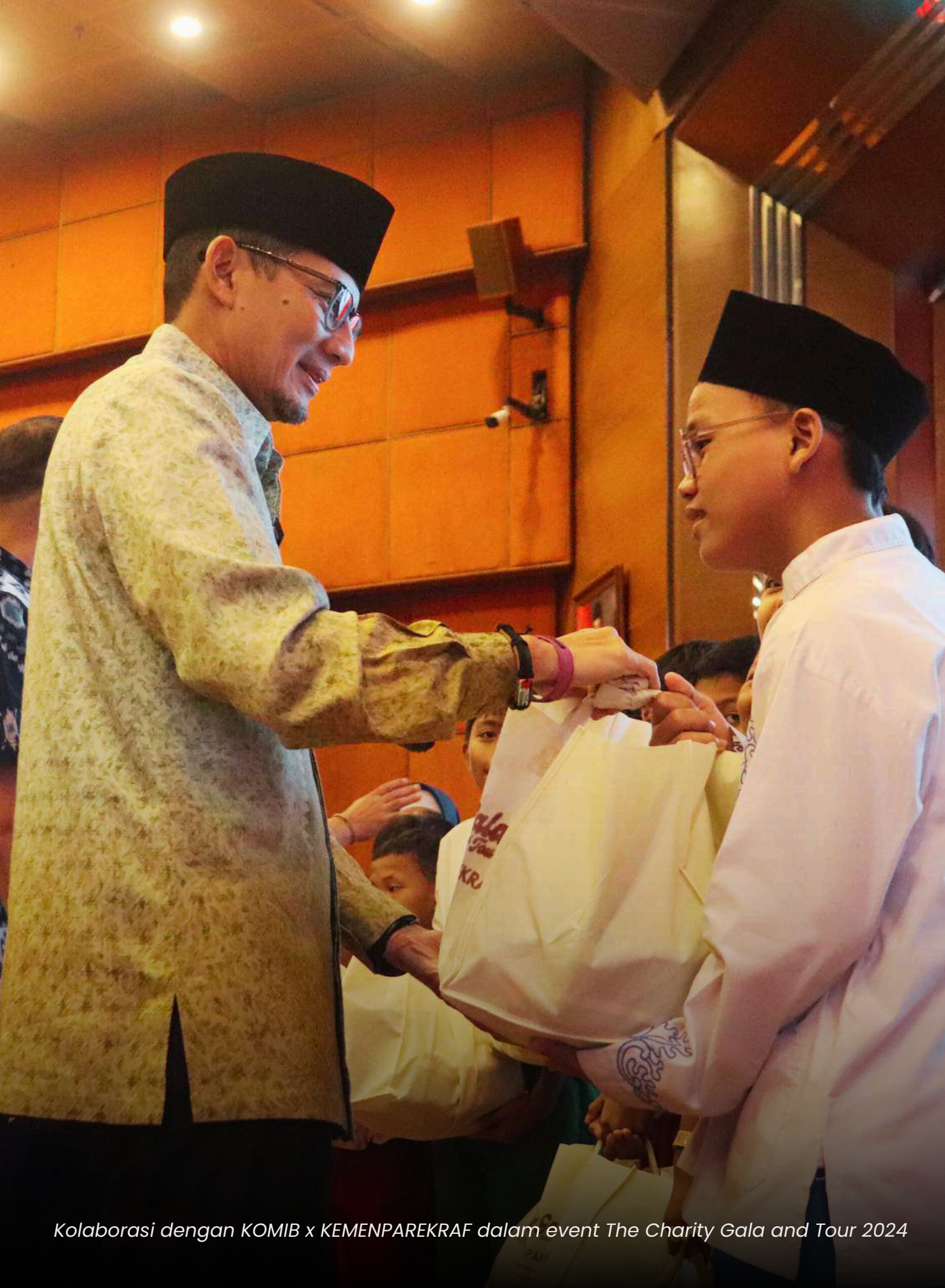
Kolaborasi dengan KOMIB x KEMENPAREKRAF dalam event The Charity Gala and Tour 2024