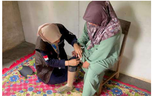
Program Peduli Difabel Penyaluran Kaki Palsu di Ciamis, Jawa Barat