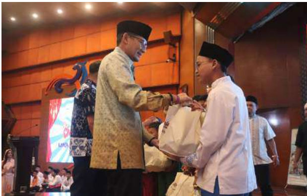
Kolaborasi dengan KOMIB x KEMENPAREKRAF dalam event The Charity Gala and Tour 2024