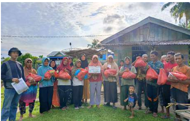
Kado Bahagia Ramadan di Aceh Besar