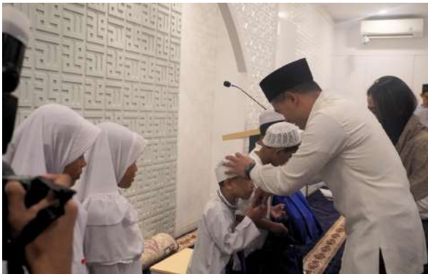
Peresmian Masjid Al Azka TCI Epicentrum