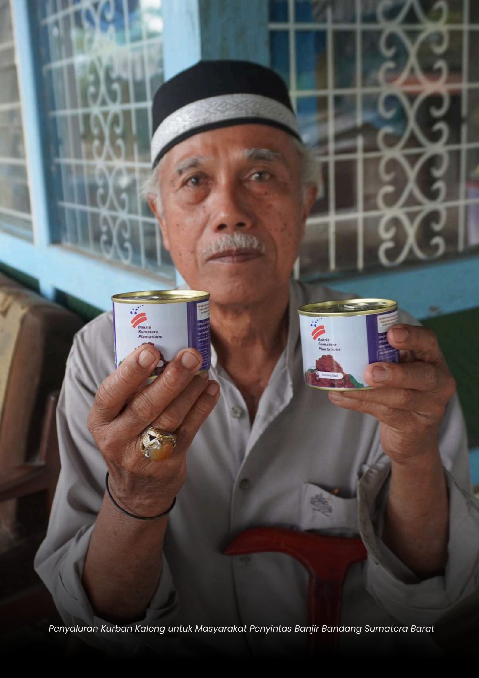
Penyaluran Kurban Kaleng untuk Masyarakat Penyintas Banjir Bandang Sumatera Barat