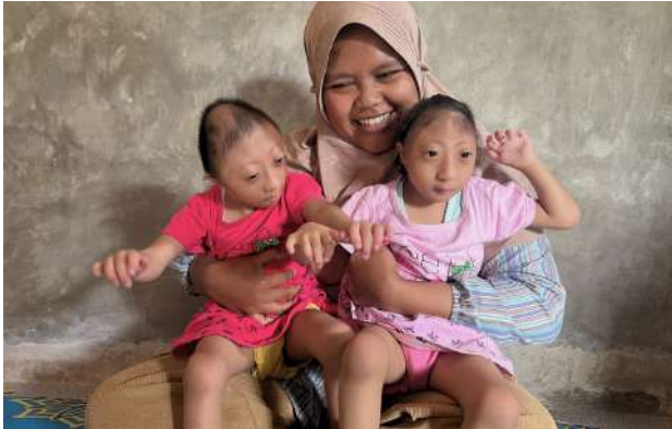
Bantuan Kesehatan Penyintas Seckel Syndrome