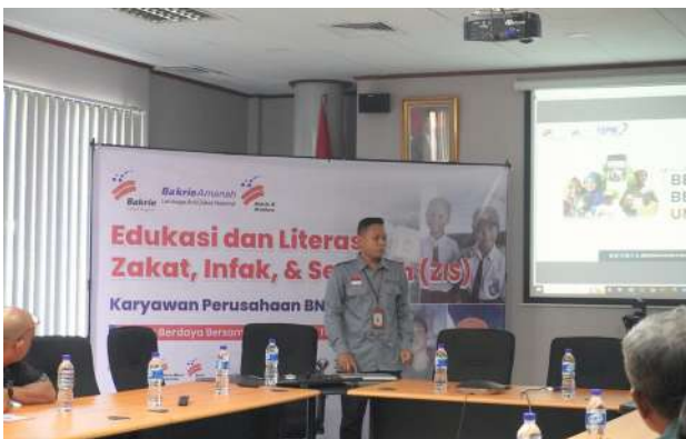
Sosialisasi ZIS Payroll PT Bakrie Pipe Industries