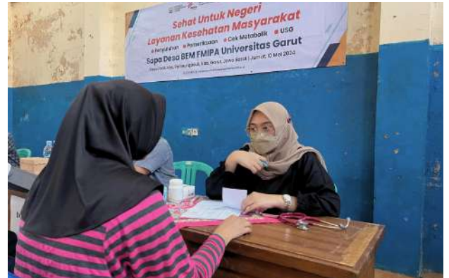
Layanan Kesehatan Universitas Garut