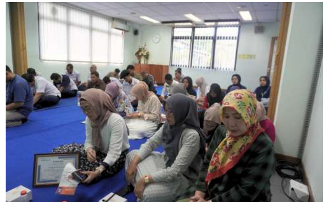
Sosialisasi ZIS Payroll PT Braja Mukti Cakra