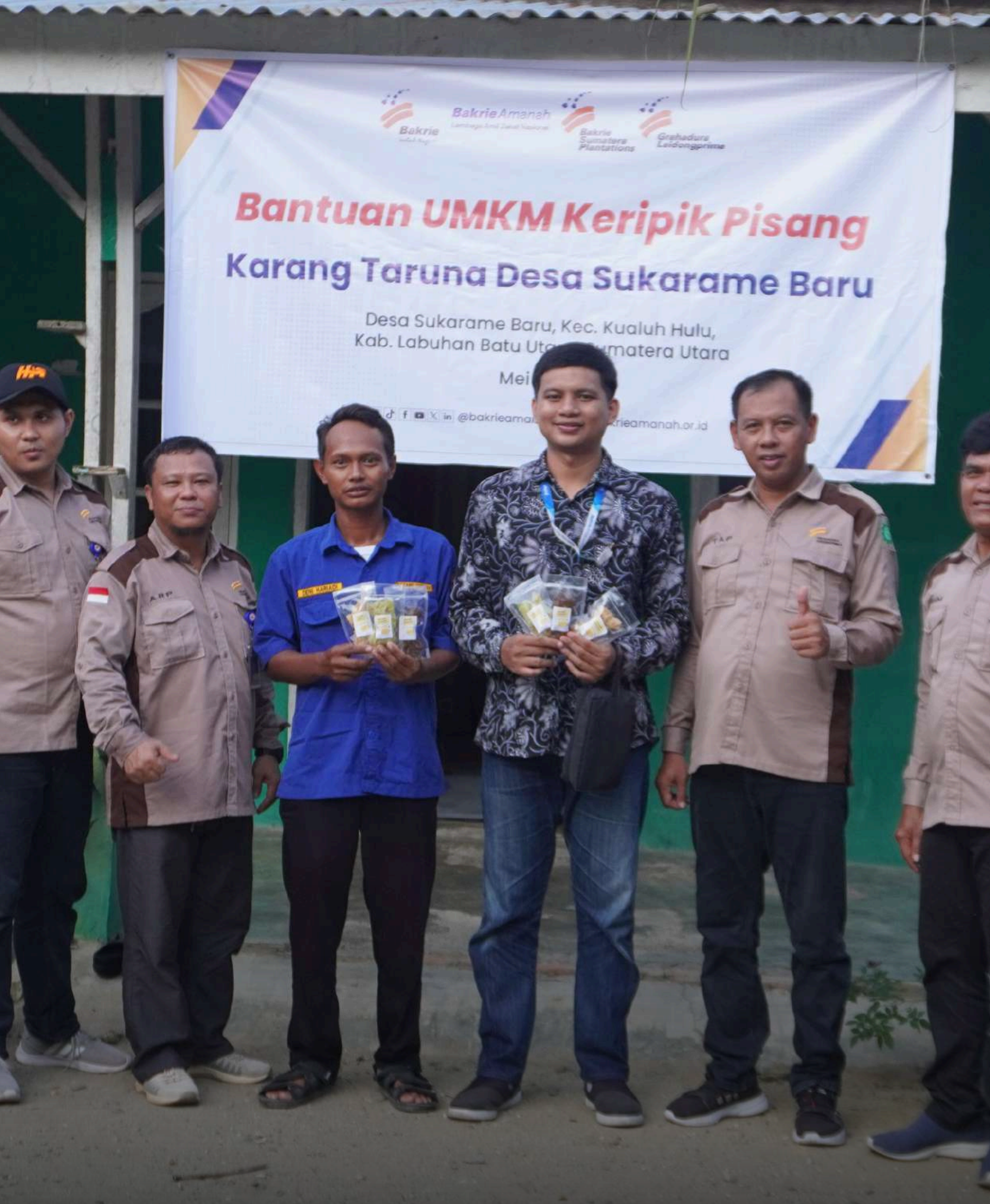
Bantuan UMKM Keripik Pisang Karang Taruna Desa Sukarame Baru, Kab. Labuhan Batu