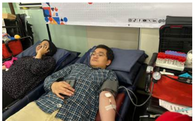
Kelompok Bakrie Gelar Donor Darah dan Pemeriksaan Kesehatan di Bakrie Tower Jakarta Selatan