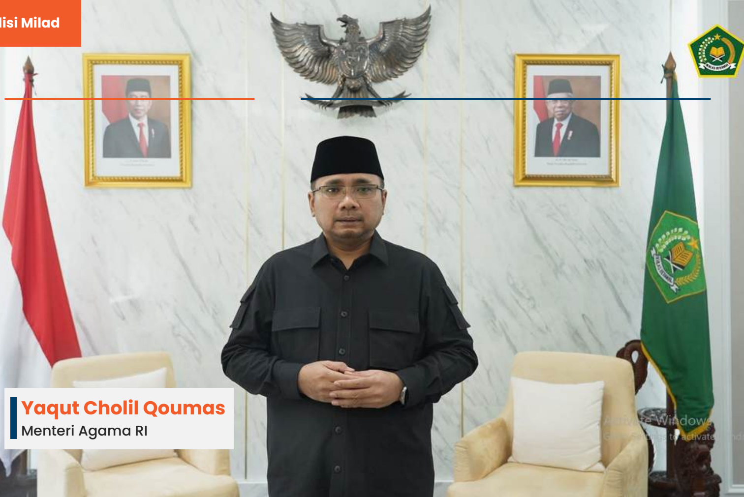
Yaqut Cholil Qoumas Menteri Agama RI