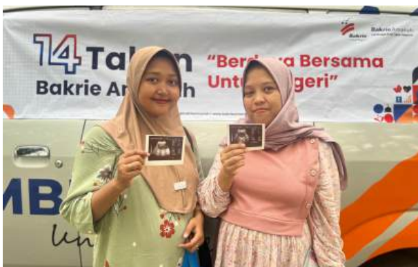
Kebahagiaan Terpancar dari Masyarakat Bandar Lampung dalam Mengikuti Layanan Kesehatan Masyarakat oleh Bakrie Amanah