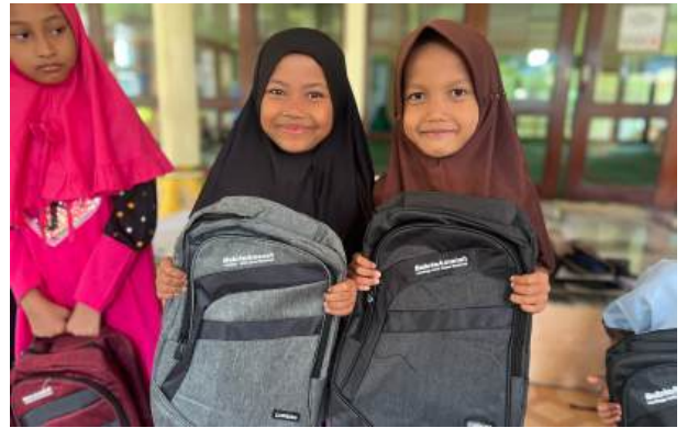
Sambut Masuk Sekolah, PT Bakrie Pipe Industries dan Bakrie Amanah Salurkan Paket Sekolah & Alat Tulis