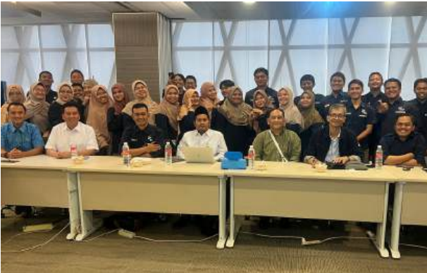
Optimalkan Kinerja, LAZNAS Bakrie Amanah Gelar Evaluasi Rapat Kerja Semester 1 Tahun 2024