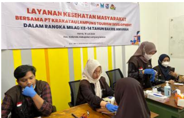
Menyambut Milad ke-14, Bakrie Amanah Berkolaborasi Bersama PT KLTD Melakukan Kegiatan LKM di Lampung