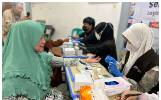
Dalam Meningkatkan Kesehatan Masyarakat Bakrie Amanah Bersama PT SEAPI Mengadakan Layanan Kesehatan Masyarakat