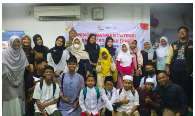
Program Pengembangan Bakat Anak: Mengenang Pahlawan dengan Semangat Kemerdekaan