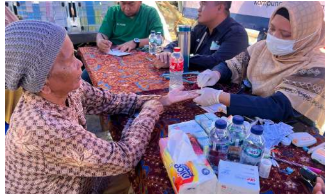
Kebahagiaan Warga Dadap Mengikuti Layanan Kesehatan Masyarakat yang diadakan Bakrie Amanah