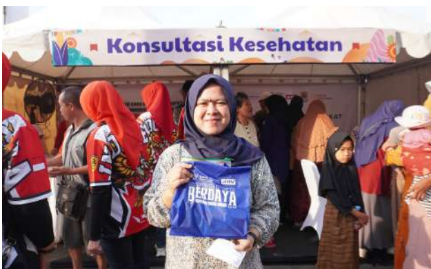
Bakrie Amanah Ajak Ratusan Warga Cek Kesehatan di Grebeg Pasar ANTV Cirebon