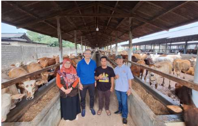
Bakrie Amanah Resmikan Program Agri Zakat Budidaya Sapi di Lampung Tengah