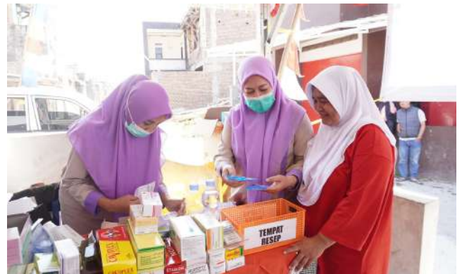
Bakrie Amanah Adakan Layanan Kesehatan Gratis, Ajak Warga Sekitar Hidup Sehat di Garut