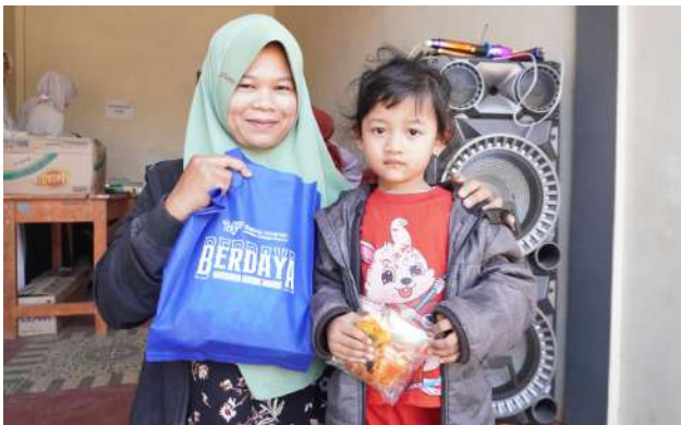
138 Warga Antusias Ikuti Penyuluhan dan Layanan Kesehatan Bakrie Amanah & Universitas Garut