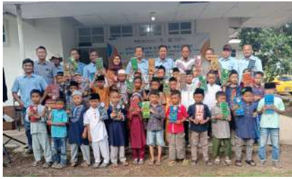
KUN 2024 - PT Huma Indah Mekar Kec. Tulang Bawang Tengah, Kab. Tulang Bawang Barat, Prov. Lampung Kamis, 19 Desember 2024