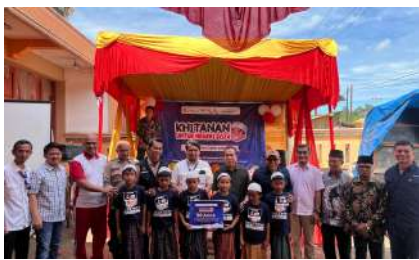
KUN 2024 - PT Citalaras Cipta Indonesia Kab. Pesisir Selatan, Sumatera Barat Sabtu, 21 Desember 2024