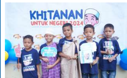
KUN 2024 - PT Citra Palu Minerals Kec. Mantikulore, Kota Palu, Prov. Sulawesi Tengah Kamis, 19 Desember 2024