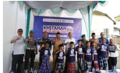
KUN 2024 - PT Energi Mega Persada Gebang Kec. Tanjung Pura, Kab. Langkat, Prov. Sumatera Utara Selasa, 17 Desember 2024