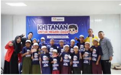
KUN 2024 - PT Dairi Prima Mineral Kec. Silima Pungga-Pungga, Kab. Dairi, Prov. Sumatera Utara Selasa, 10 Desember 2024