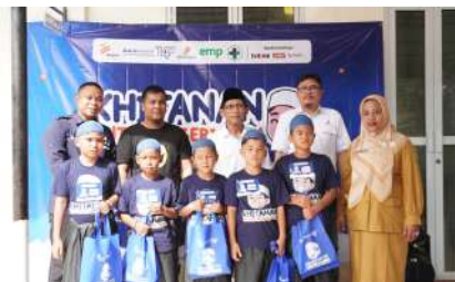
KUN 2024 - PT Energi Mega Persada Tonga Kec. Padang Garugur, Kab. Padang Lawas, Prov. Sumatera Utara Selasa, 17 Desember 2024