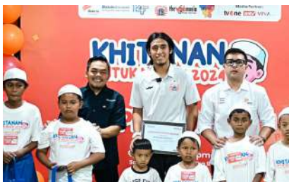
KUN 2024 - Persija Development Kec. Sawangan, Kota Depok, Prov. Jawa Barat Senin, 23 Desember 2024