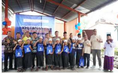
KUN 2024 - PT Grahadura Leidongprima Kec. Kualuh Hulu, Kab. Labuhanbatu Utara, Prov. Sumatera Utara Kamis, 19 Desember 2024