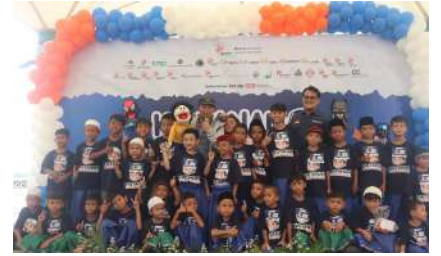
KUN 2024 - Masjid Al Bakrie Taman Rasuna Kec. Setiabudi, Kota Jakarta Selatan, Prov. DK Jakarta Sabtu, 14 Desember 2024