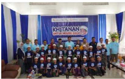
KUN 2024 - PT Bakrie Sumatera Plantations Tbk Kec. Kota Kisaran Timur, Kab. Asahan, Sumatera Utara Sabtu, 21 Desember 2024