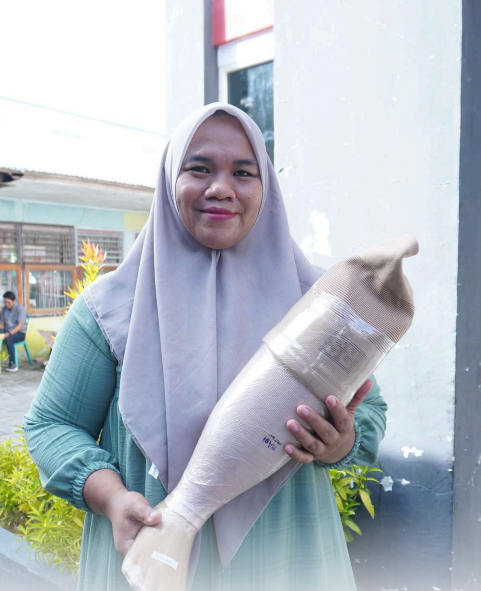
Program Peduli Difabel: Penyaluran Kaki Palsu di Kota Palu, Sulawesi Tengah bersama PT Citra Palu Minerals (CPM)