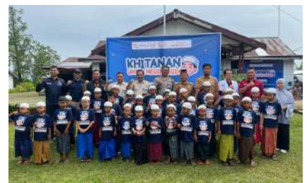
KUN 2024 - PT Air Muring Kec. Putri Hijau & Kec. Marga Sakti, Kab. Bengkulu Utara, Prov. Bengkulu Selasa, 24 Desember 2024