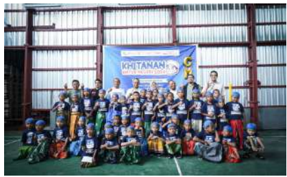
KUN 2024 - PT Gorontalo Minerals Kec. Bone, Kab. Bone Bolango, Prov. Gorontalo Minggu, 22 Desember 2024