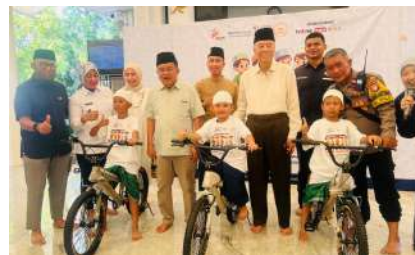
KUN 2024 - Masjid Nurul Hidayah Jakarta Kec. Kebayoran Baru, Kota Jakarta Selatan, DK Jakarta Rabu, 18 Desember 2024