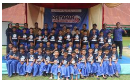
KUN 2024 - PT Agrowiyana Kec. Tebing Tinggi, Kab. Tanjung Jabung Barat, Prov. Jambi Selasa, 24 Desember 2024