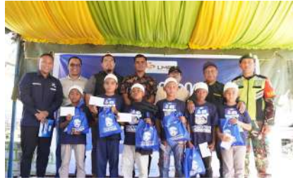
KUN 2024 - PT Linge Mineral Resources Kec. Linge, Kab. Aceh Tengah, Prov. Aceh Sabtu, 14 Desember 2024