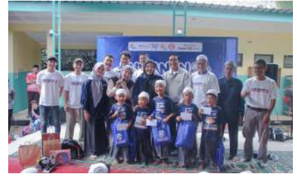
KUN 2024 - PT Bina Usaha Mandiri Mizusawa Kec. Jatiuwung, Kab. Tangerang, Prov. Banten Sabtu, 21 Desember 2024