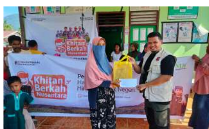
KUN 2024 - Baitul Maal Hidayatullah Kab. Pulau Morotai, Maluku Utara 28 Desember 2024