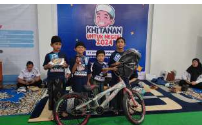
KUN 2024 - PT Arutmin Indonesia Tambang Batulicin Kec. Batulicin, Kab. Tanah Bumbu, Prov. Kalimantan Selatan Rabu, 18 Desember 2024