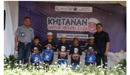
KUN 2024 - PT Arutmin Indonesia Tambang Satui Kec. Satui, Kab. Tanah Bumbu, Prov. Kalimantan Selatan Selasa, 17 Desember 2024