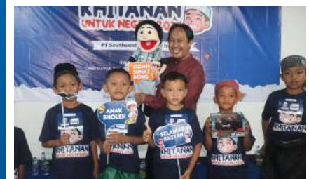
KUN 2024 - PT Southeast Asia Pipe Industries Kec. Ketapang Bakauheni, Lampung Selatan, Lampung Kamis, 19 Desember 2024