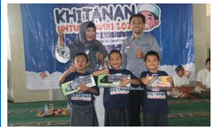
KUN 2024 - Masjid Al Oesman Pengajaran, Kec. Teluk Betung, Kota Bandar Lampung Sabtu, 21 Desember 2024