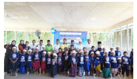
KUN 2024 - Masjid Al Bakrie Lero Kec. Sundue, Kab. Donggala, Prov. Sulawesi Tengah Rabu, 18 Desember 2024