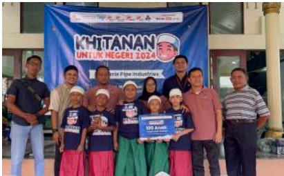
KUN 2024 - PT Bakrie Pipe Industries Kec. Medan Satria, Kota Bekasi, Prov. Jawa Barat Minggu, 15 Desember 2024