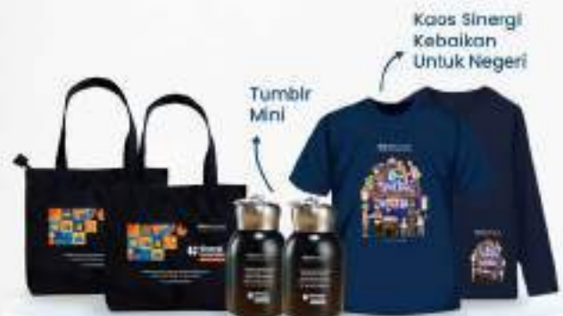
Tote Bag Sinergi Kebajikan Untuk Negeri