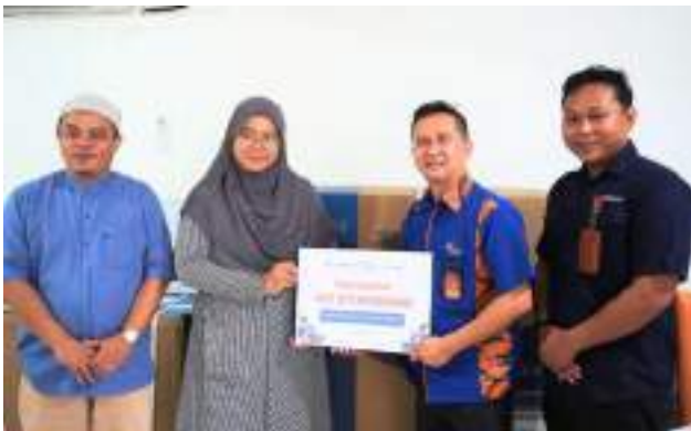
Penyaluran AC Standing untuk Islamic Center Kota Bekasi, Jawa Barat