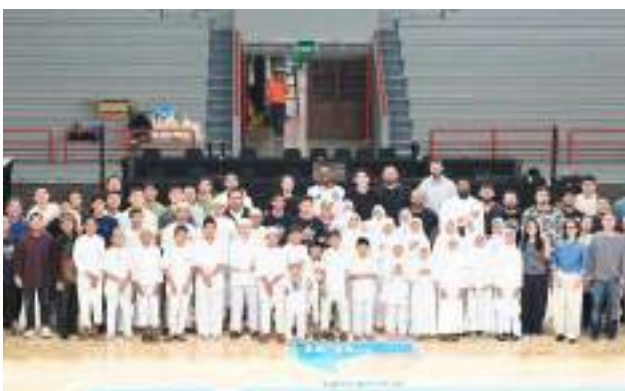
Doa Bersama & Santunan Yatim/Dhuafa Tasyakur Pelita Jaya Memasuki Play Offs