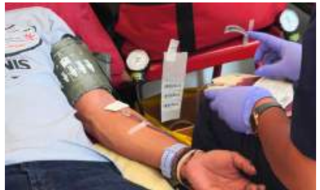
Kegiatan Donor Darah dan Cek Metabolik Masjid Nurul Hidayah, Keb. Baru, Jakarta Selatan