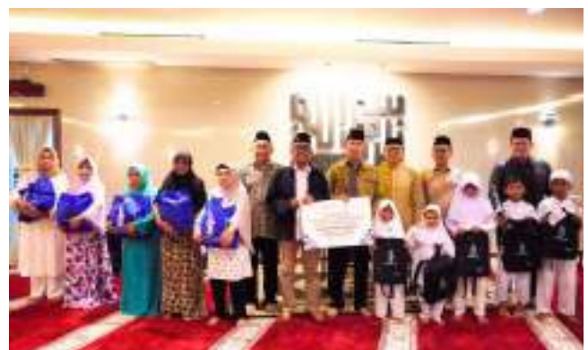
Santunan 100 Anak Yatim Dhuafa & 100 Janda Lansia, Masjid Burj Al Bakrie