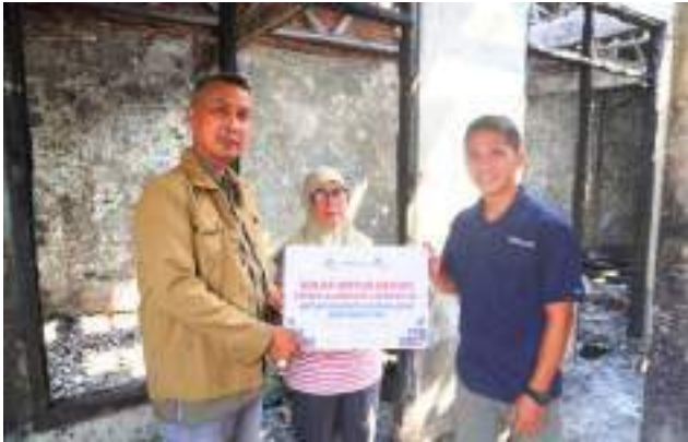
Penyaluran Logistik untuk Penyintas Kebakaran di Kec. Menteng Atas, Jakarta Selatan