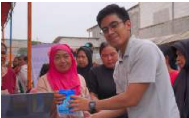
Bakrie Amanah Kembali Menggelar Layanan Kesehatan Masyarakat di Kampung Dadap