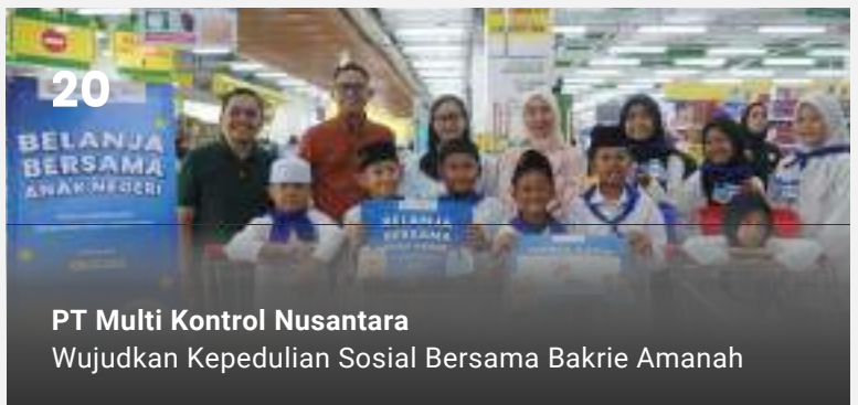
20 PT Multi Kontrol Nusantara Wujudkan Kepedulian Sosial Bersama Bakrie Amanah