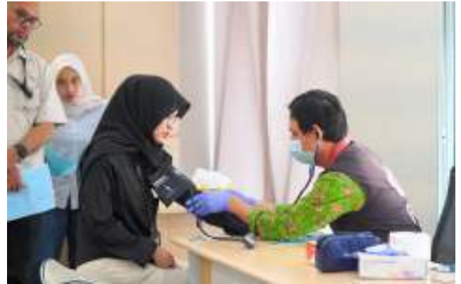
Bakrie Sumatera Plantations dan Bumi Resources Minerals Gelar Donor Darah dan Cek Metabolik