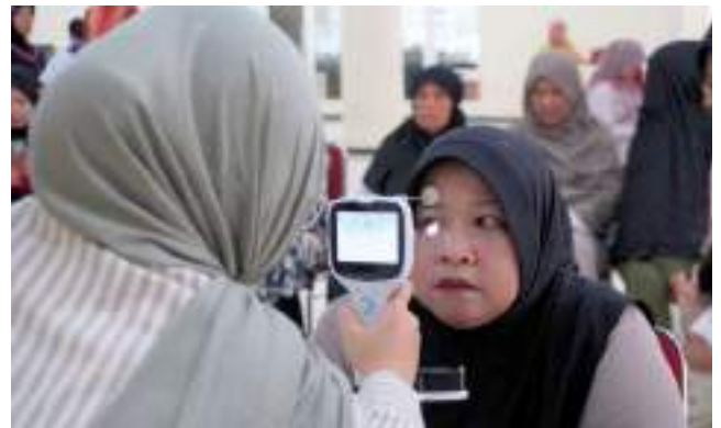
Donor Darah, Cek Mata, dan Konsultasi Kesehatan dalam Layanan Kesehatan Masyarakat di Masjid Al Bakrie Taman Rasuna, Jakarta Selatan