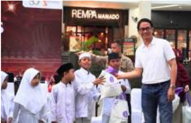
Adinda Bakrie Foundation Dukung Konser 30 Tahun Twilite Chorus Bersama 100 Anak Yatim & Dhuafa