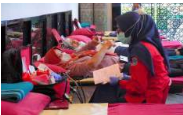
Tingkatkan Kesehatan Masyarakat melalui Layanan Kesehatan Masyarakat di Masjid Nurul Hidayah, Jakarta Selatan