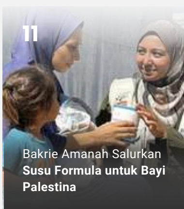
11 Bakrie Amanah Salurkan Susu Formula untuk Bayi Palestina