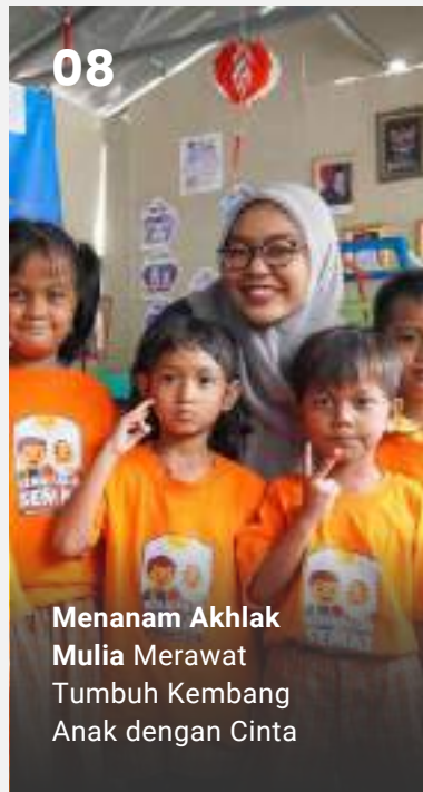
08 Menanam Akhlak Mulia Merawat Tumbuh Kembang Anak dengan Cinta