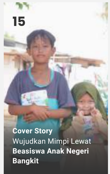
15 Cover Story Wujudkan Mimpi Lewat Beasiswa Anak Negeri Bangkit