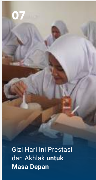
Gizi Hari Ini Prestasi dan Akhlak untuk Masa Depan