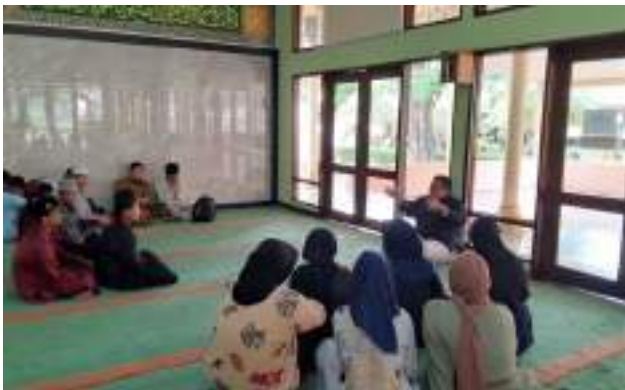
Kegiatan PPBA yang Dilaksanakan di Jakarta dan Bekasi yang Bertemakan "Semangat Persatuan dari Sumpah Pemuda"