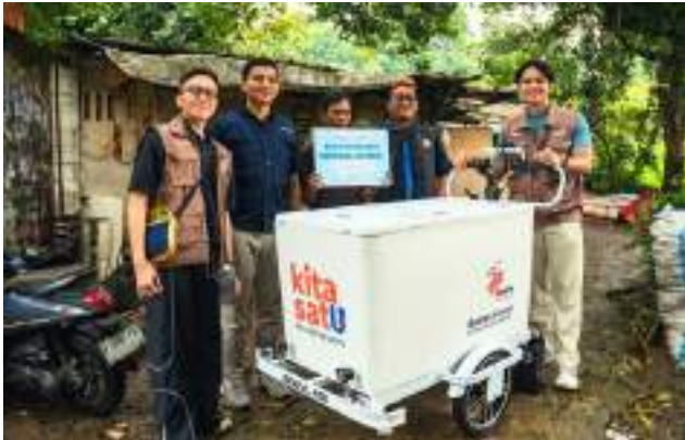
Bakrie untuk Negeri dan Bakrie Amanah Salurkan Gerobak Listrik Dukung Pemulihan Usaha Pedagang Pempek