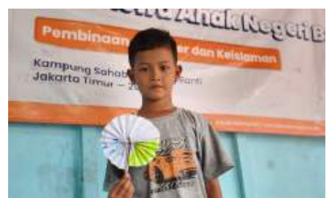
Pembinaan Karakter dan Keislaman Beasiswa Anak Negeri Bangkit (ANB)