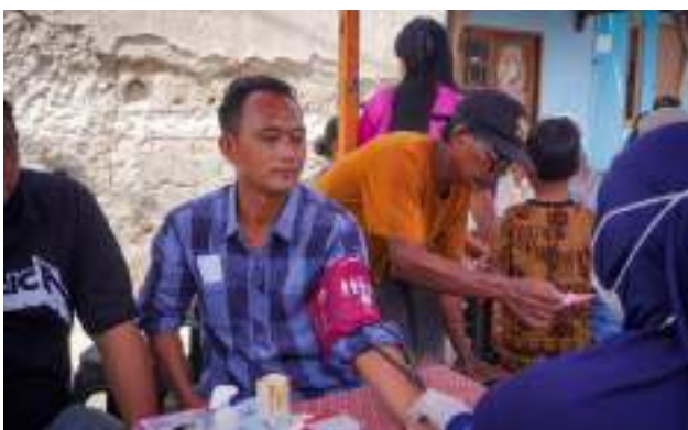
Layanan Kesehatan Masyarakat dan Posyandu Mandiri Rutin di Kampung Dadap