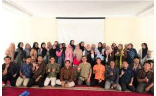
Training & Development Bakrie Amanah: Membangun Mindfulness di Lingkungan Kerja