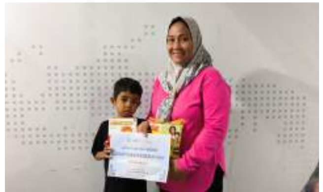
Penyaluran Bantuan Kesehatan untuk Ramadhan Al Fatih