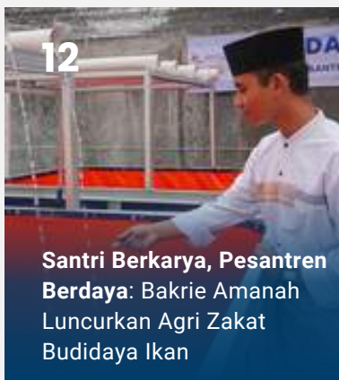
Santri Berkarya, Pesantren Berdaya: Bakrie Amanah Luncurkan Agri Zakat Budidaya Ikan