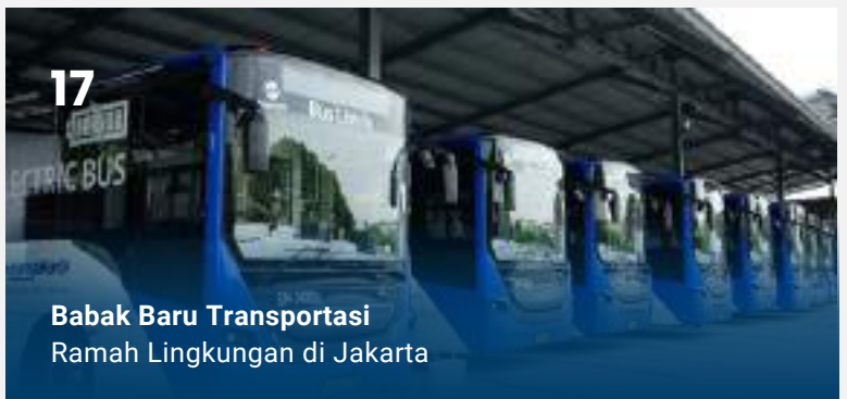
Babak Baru Transportasi Ramah Lingkungan di Jakarta