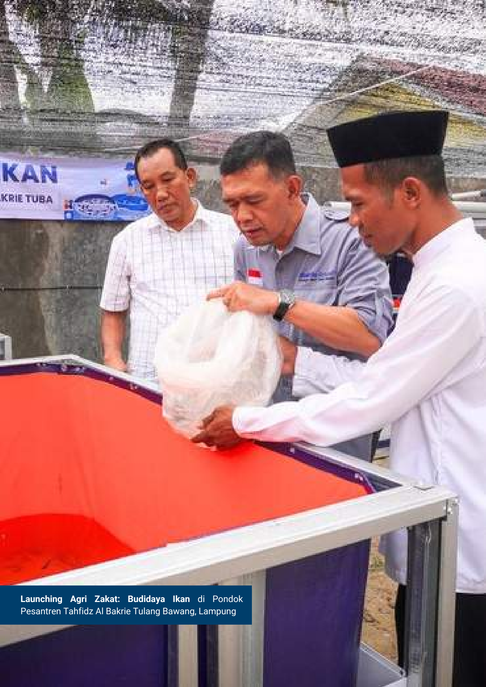
Launching Agri Zakat: Budidaya Ikan di Pondok Pesantren Tahfidz Al Bakrie Tulang Bawang, Lampung