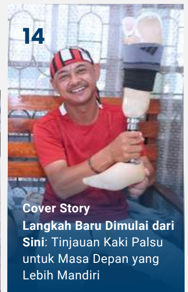
Cover Story Langkah Baru Dimulai dari Sini: Tinjauan Kaki Palsu untuk Masa Depan yang Lebih Mandiri