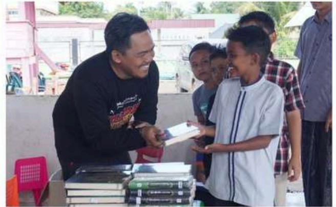
Penyaluran Al-Qur'an bagi Warga Terdampak Banjir di Blang Guron, Gandapura, Bireuen