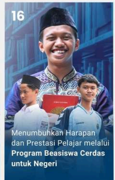
Menumbuhkan Harapan dan Prestasi Pelajar melalui Program Beasiswa Cerdas untuk Negeri