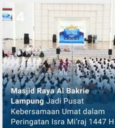
Masjid Raya Al Bakrie Lampung Jadi Pusat Kebersamaan Umat dalam Peringatan Isra Mi'raj 1447 H