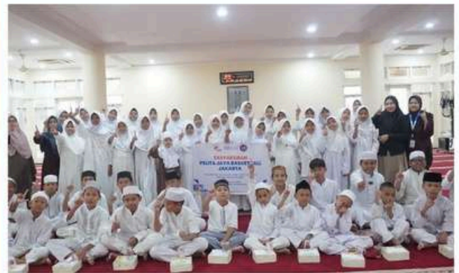
Santunan dan Doa Bersama Pelita Jaya Basketball Jakarta