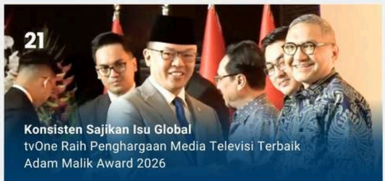
Konsisten Sajikan Isu Global tvOne Raih Penghargaan Media Televisi Terbaik Adam Malik Award 2026