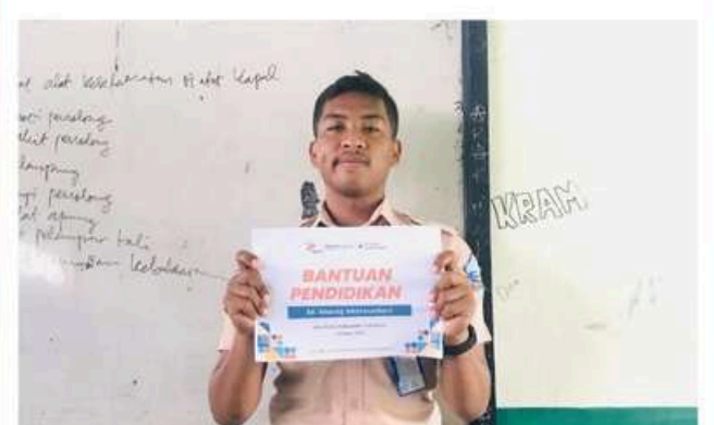
Penyaluran Bantuan Pendidikan Kepada Penerima Manfaat