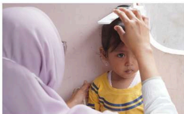
Layanan Posyandu Mandiri di Kampung Dadap, Tangerang, Banten