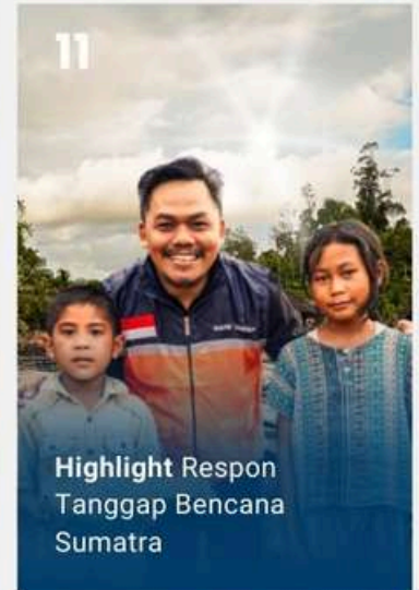
Highlight Respon Tanggap Bencana Sumatra