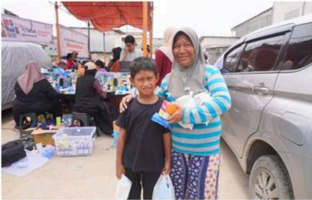
Kegiatan Layanan Kesehatan Masyarakat dan Posyandu Mandiri di Kampung Dadap, Tangerang, Banten