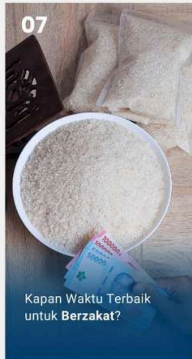
Kapan Waktu Terbaik untuk Berzakat?