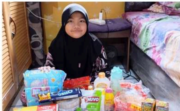
Penyaluran Bantuan Kesehatan Kepada Penerima Manfaat