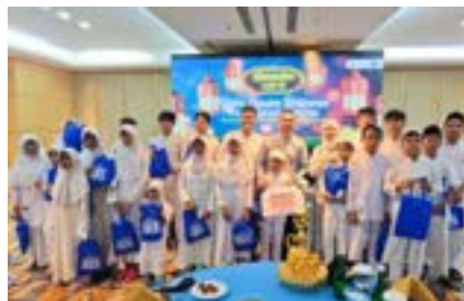
Kehangatan dalam Berbagi kepada Anak Yatim & Dhuafa bersama PT Bakrieland Development Tbk