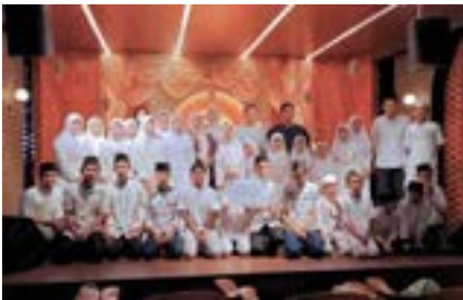
Buka Bersama dan Santunan Anak Yatim & Dhuafa bersama PT Bakrie Pesona Rasuna dan Plaza Festival