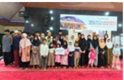
Berbagi Kebahagiaan di Bulan Suci Ramadan bersama PT Bakrie Autoparts