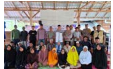
Menguatkan Kepedulian di Bulan Suci dengan Berbagi Bersama PT Bumi Resources Minerals Tbk