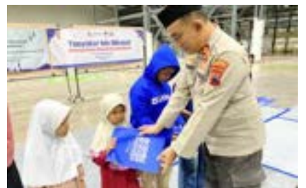
Wujud Syukur di Bulan Ramadhan dengan Berbagi bersama PT VKTR Sakti Industries