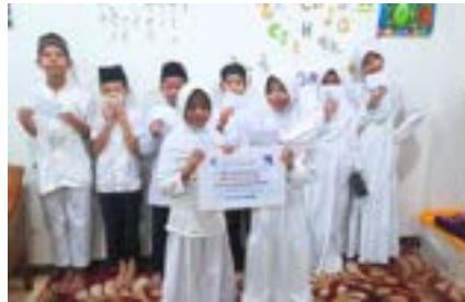
Indahnya Berbagi bersama PT Cakrawala Andalas Televisi (ANTV)