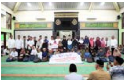
Kehangatan di Bulan Ramadhan dengan Berbagi bersama PT Bakrie Pipe Industries