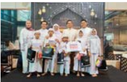
Buka Bersama dan Santunan Anak Yatim & Dhuafa bersama Elite Club Epicentrum