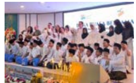
Menebar Berkah Ramadan dengan Berbagi bersama PT Bakrie & Brothers Tbk