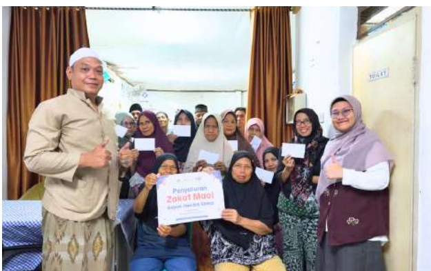
Tebar Manfaat Zakat Maal bagi Warga Jatinegara, Jakarta Timur