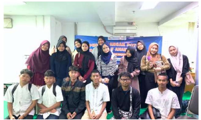
Pengembangan Potensi Bakat Anak Penerima Beasiswa Cerdas Untuk Negeri