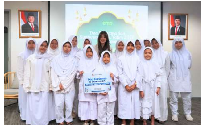
Wujudkan Kepedulian Sosial, PT Energi Mega Persada Tbk Selenggarakan Santunan Anak Yatim dan Doa Bersama