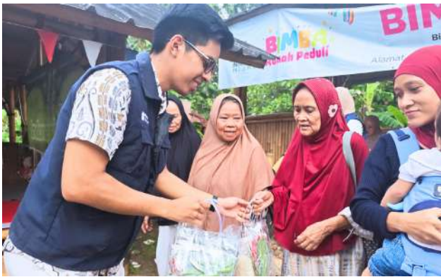
Program Mari Berbagi Gizi Bantu Pemenuhan Nutrisi Warga di Pasar Minggu, Jakarta Selatan