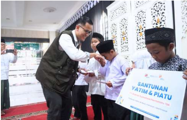
Kolaborasi Penuh Keberkahan, PT Bakrie Sumatera Plantations Tbk Memperkuat Komitmen Sosial melalui Penyaluran Santunan Yatim & Piatu