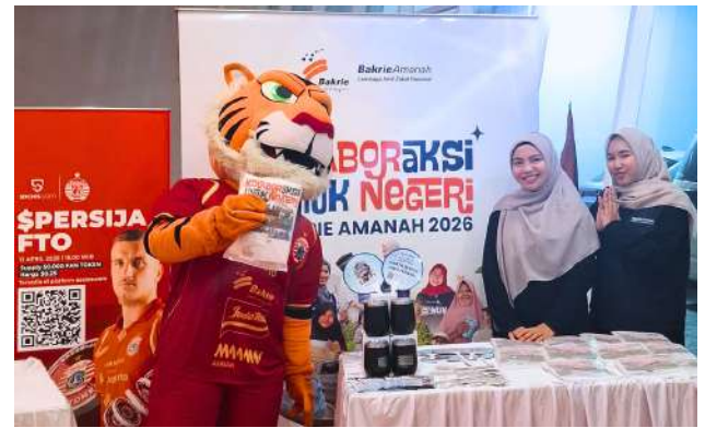
Bersama Bakrie Untuk Negeri, Gerai Bakrie Amanah Hadir di Donor Darah Persija